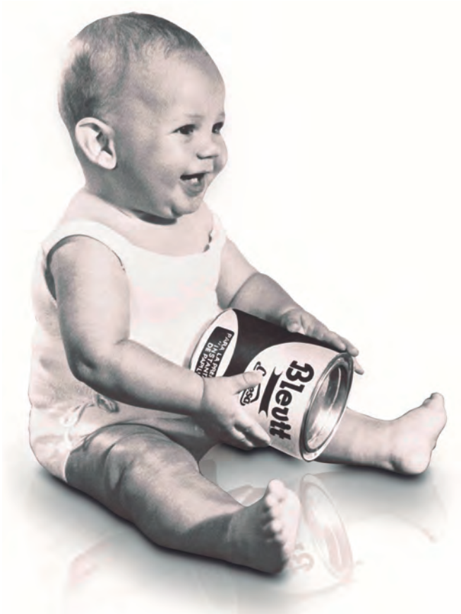
FIGURA 1. Imatge de publicitat de Blevit dels anys cinquanta.

Així, a finals de la dècada dels anys cinquanta, Ordesa comercialitzava diferents especialitats, com ara llet en pols maternitzada; farinetes torrades, vitaminades i làcties, i un succedani de xocolata amb el nom de Nutro-Ordesa. De tots aquests productes, les farinetes infantils és el que tenia més demanda i el que requeria un